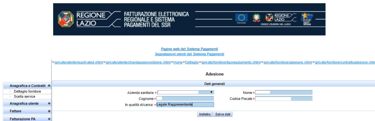
Figura 4 - Adesione_Dati generali_Disciplina_Uniforme

Inserire i dati obbligatori richiesti (contrassegnati da asterisco rosso) relativi all'Azienda Sanitaria competente ed ai dati anagrafici del Legale Rappresentante/Procuratore della Società e poi cliccare sul pulsante " Salva dati ".