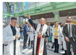
Il cardinale benedice il Policlinico di Tor Vergata

professione di fede civile». Secondo il vicario del Papa per la diocesi di Roma, la nuova configurazione del Policlinico rappresenta la conferma che «ricerca, didattica e cura non possano camminare separate». Il cardinale ha indicato tre direttrici fondamentali della missione del Policlinico universitario: cura, ricerca e formazione. La cura, ha spiegato, resta il fondamento stesso dell'ospedale e trova nella tradizione evangelica del buon samaritano il proprio riferimento umano e culturale. «La dignità di un ospedale si misura sulla qualità della relazione con i più fragili», ha affermato, soffermandosi anche sulle difficoltà vissute dal personale sanitario, tra carichi di lavoro elevati, fuga dei giovani medici e rischio di «stanchezza dell'anima». Sul fronte della ricerca, il cardinale ha richiamato la necessità di mantenere